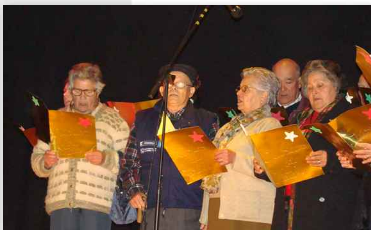
Concurso de Canções de Natal do Centro Geriátrico "Solar das Camélias"