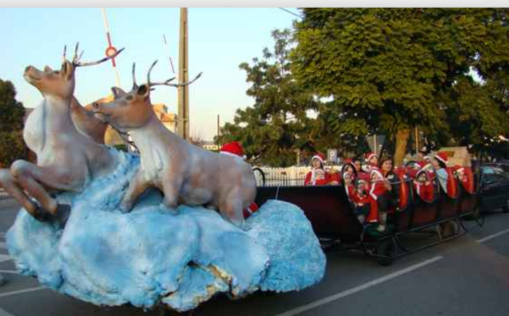
Animação de Natal nas ruas da Vila, promovida pela PRAVE