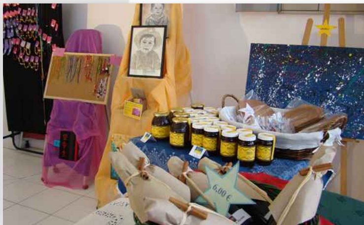
Venda de Natal de Artesanato