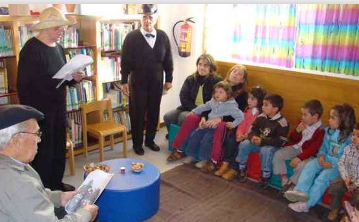
Hora de Conto dramatizada por seniores do Centro Social e Paroquial de St ª . Eulália, na Biblioteca Municipal