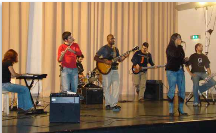
Concerto dos "Chão Nosso", no CCB