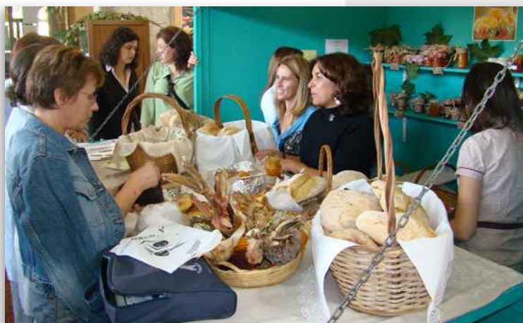
Feira de Outono promovida pelo Projecto de Educação para a Saúde do Agrupamento de Escolas de Albergaria-a-Velha