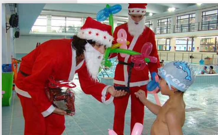
Festa de Natal nas Piscinas Municipais