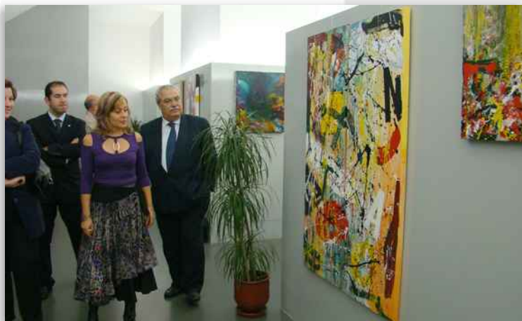
Exposição de pintura "Cores da Saudade", de Lis Pereira, no CCB