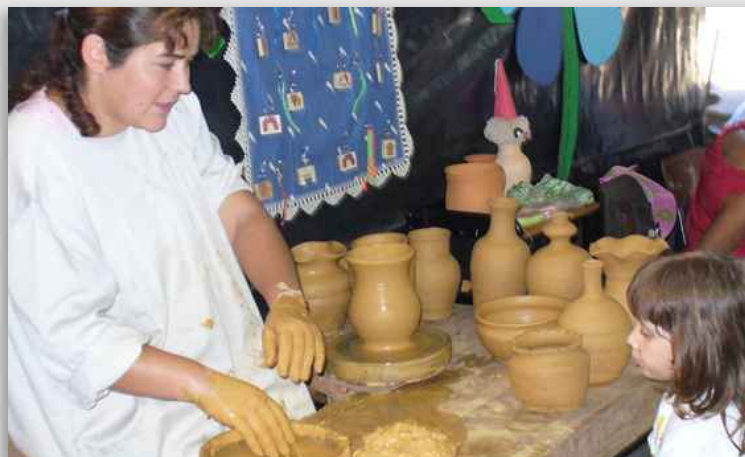
XI Feira e Exposição de Artesanato de Valmaior