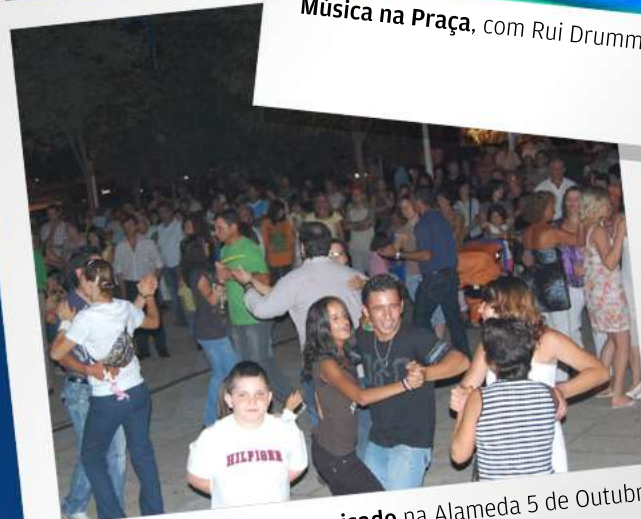
Baile improvisado na Alameda 5 de Outubro