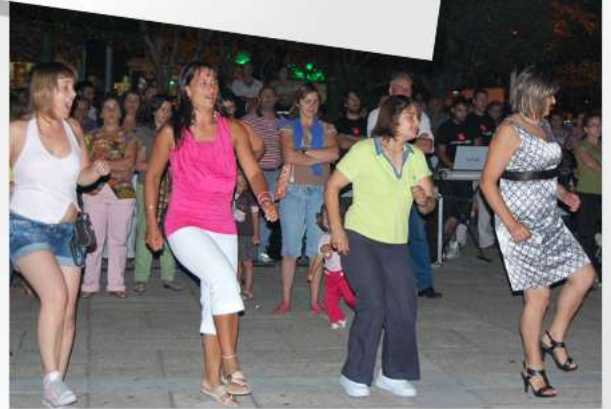
Animação na plateia