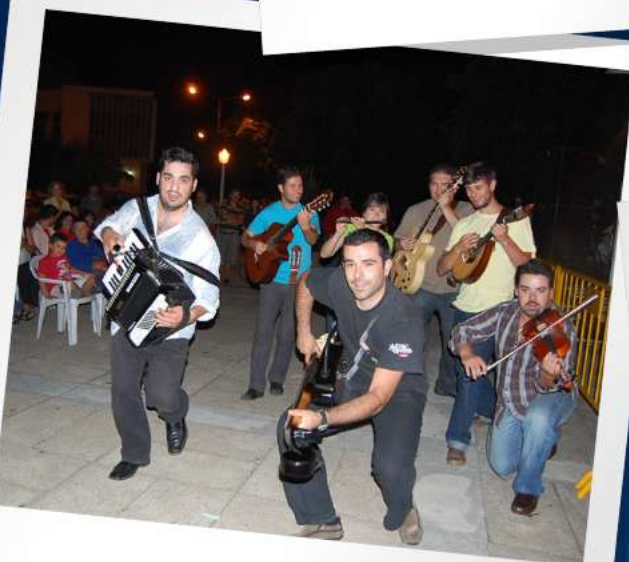
Toques do Caramulo