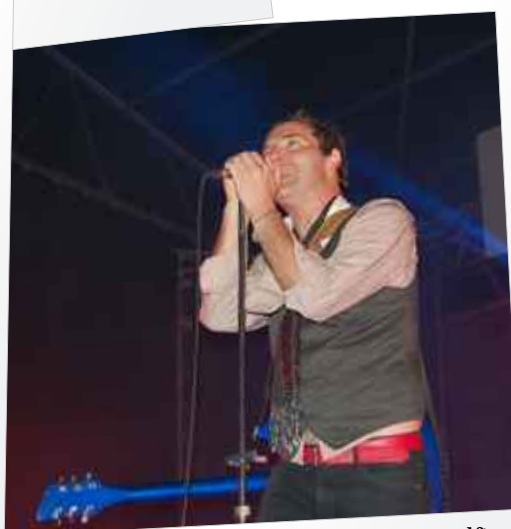
Concerto dos "Delfins"