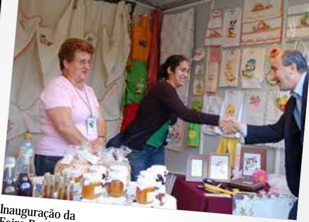
Inauguração da Feira Regional de Artesanato e Gastronomia