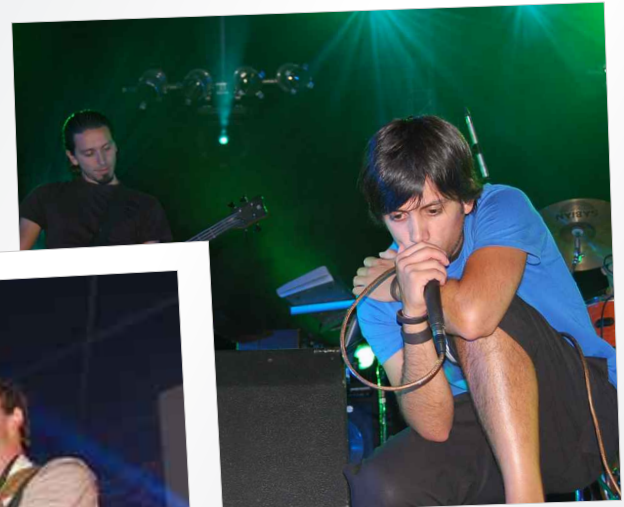
Concerto dos "Skypho"