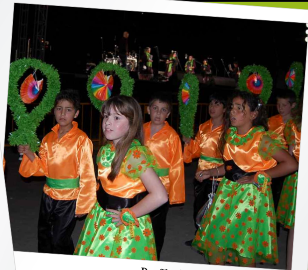
Desfile de Marchas Populares