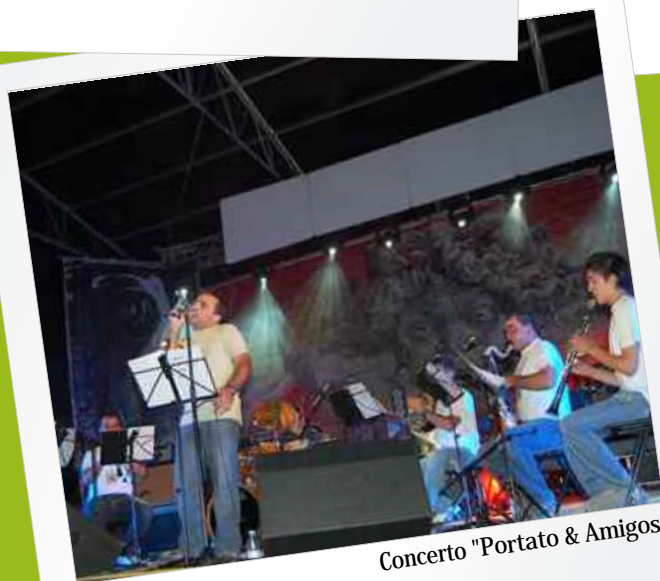
Concerto "Portato & Amigos"