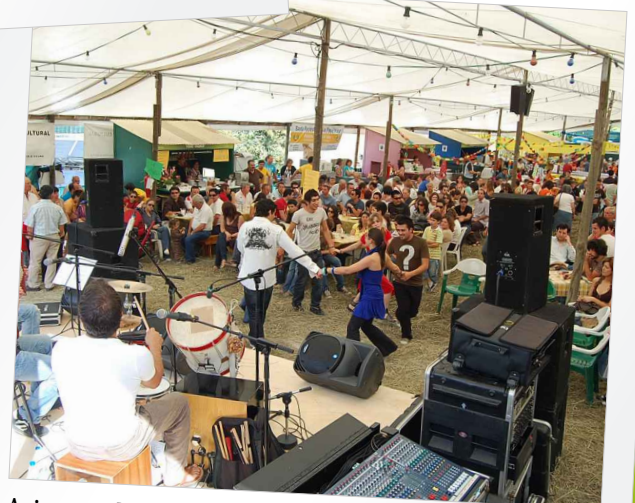
Animação das Tasquinhas com os "Polk"