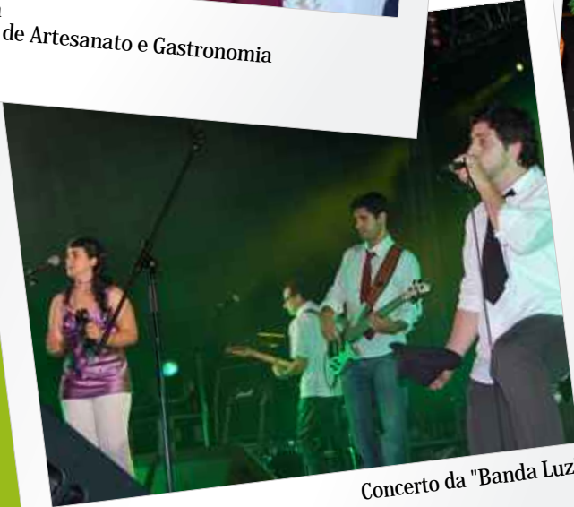
Concerto da "Banda Luz"