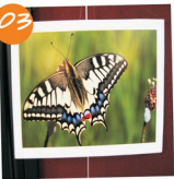
Exposição Fotográfica BioClick, na Biblioteca Municipal