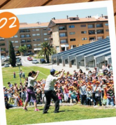
Festa da Criança