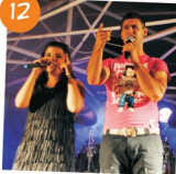
Animação de Verão 2011 - concerto com Banda Smile