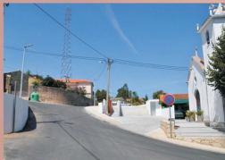
1 - Arranjo urbanístico do Largo da Capela de Nossa Senhora da Boa Hora - Nobrijo (Branca)