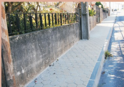
2 - Execução de passeios na Rua do Reguinho - Campinho (Albergaria-a-Velha)