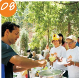
Convívio final de ano lectivo do Programa Idade Maior