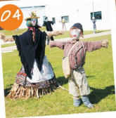
Exposição de Espantalhos "Branca de Espant" Arte"