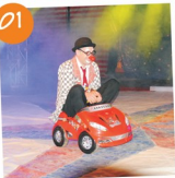
1- Alberg, Circus 5 - encontro de malabarismo, artes do circo e mais...