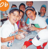
Ateliers de Verão 2011.