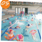
Festival de Encerramento das Piscinas Municipais