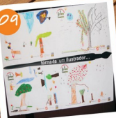
Exposição Iconográfica "Em Roda do Conto... A Árvore Generosa", na Biblioteca Municipal