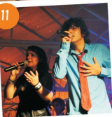
Animação de Verão 2011 - concerto com Banda Luz