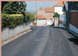
3 - Pavimentação da Rua do Laranjeiro (Branca)