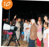
Astronomia no Verão.