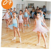
Processo de certificação internacional das bailarinas da Secção de Ballet do Clube de Albergaria