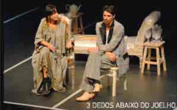
3 DEDOS ABAIXO DO JOELHO