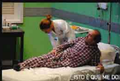
ISTO É QUE ME DOI