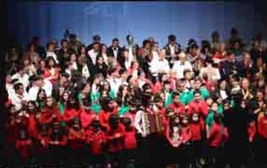
CONCERTO DE REIS