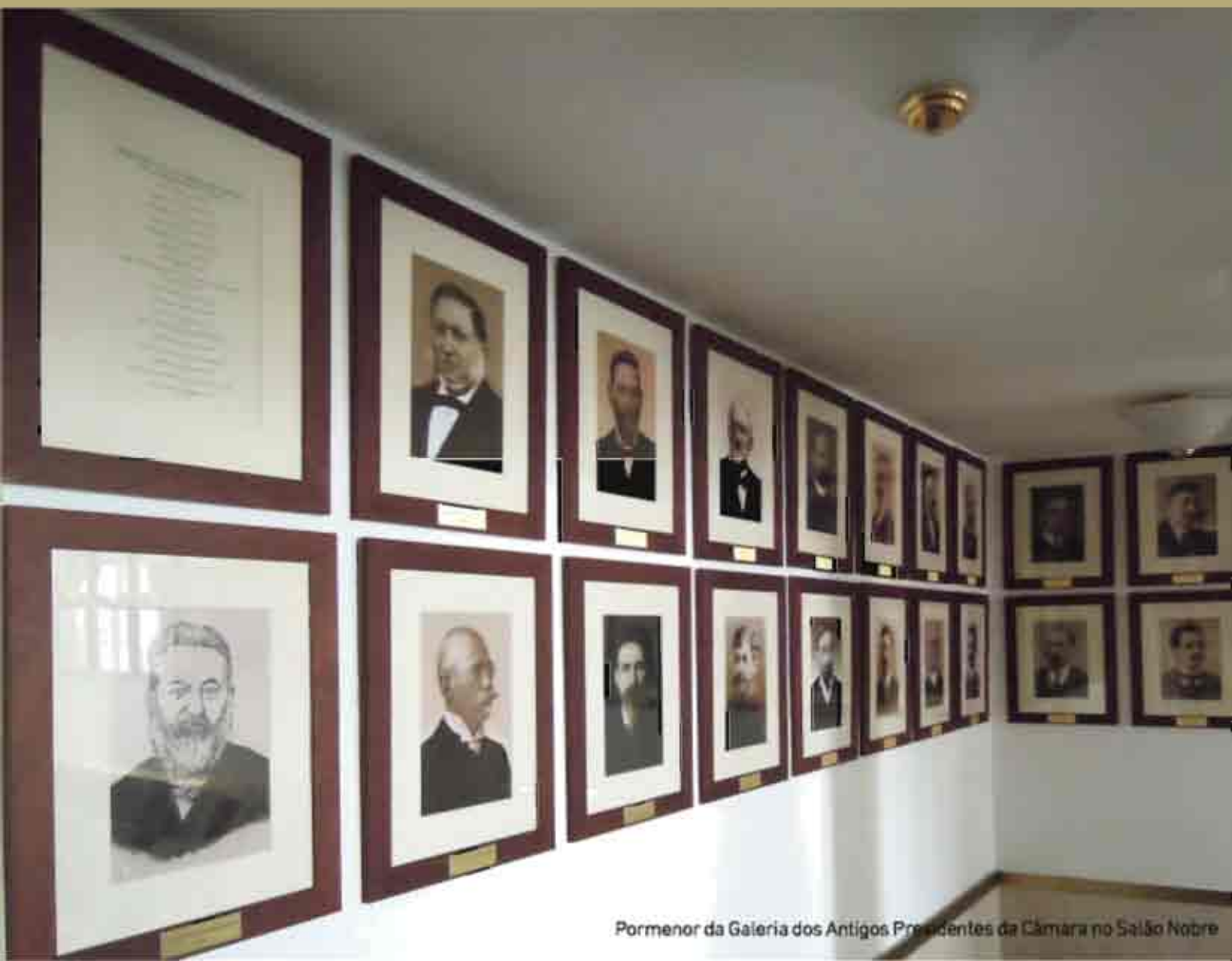
Pormenor da Galeria dos Antigos Presidentes da Câmara no Salão Nobre