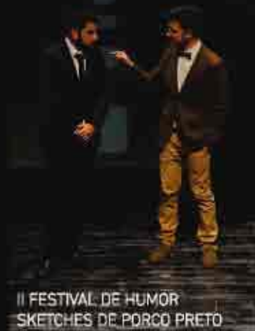
II FESTIVAL DE HUMOR SKETCHES DE PORCO PRETO