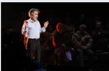
Em Memória ou a Vida Inteira Dentro de Mim