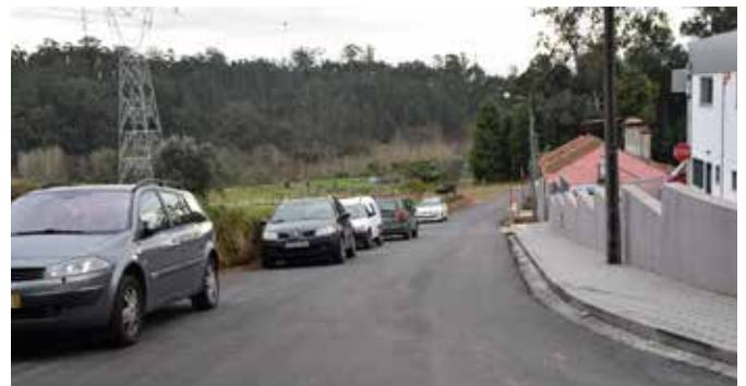
Rua de Santa Ana - Azenhas