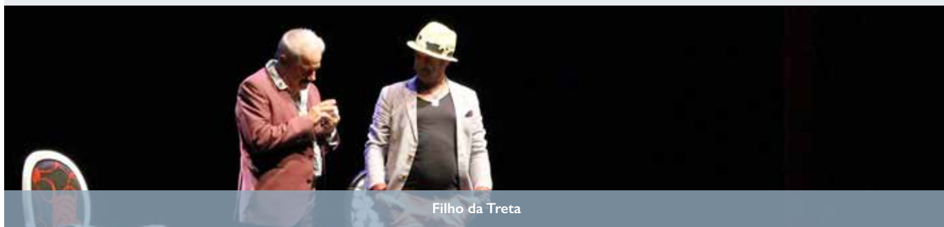
Filho da Treta