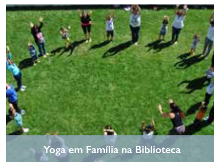
Yoga em Família na Biblioteca