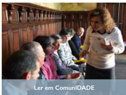
Ler em ComunIDADE