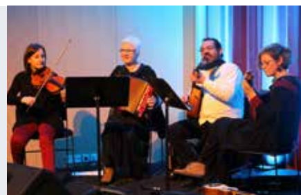
Do Pé P'ra Mão