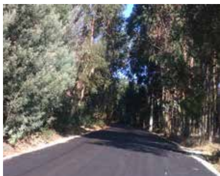
Rua do Corgo - Alquerubim