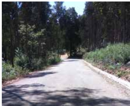
Estrada de Fradelos ao Carvalho