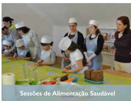
Sessões de Alimentação Saudável