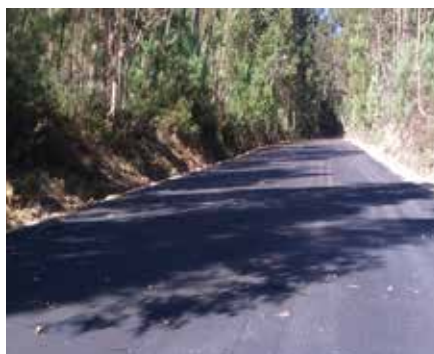
Rua Senhora do Carmo - Fontão