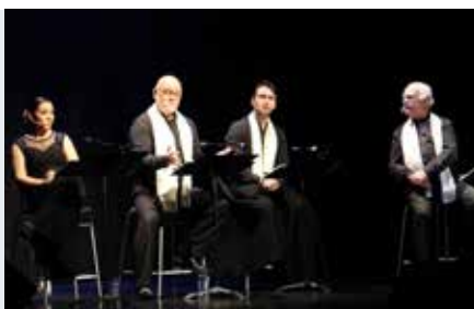
Trovas & Canções