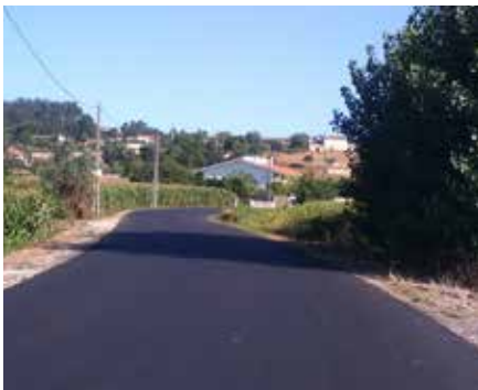
Estrada da Fontinha - Alquerubim