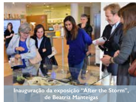
Inauguração da exposição "After the Storm", de Beatriz Manteigas