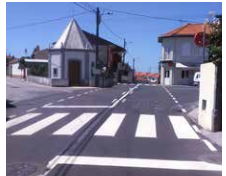
Estrada de Fradelos ao Forno da Telha