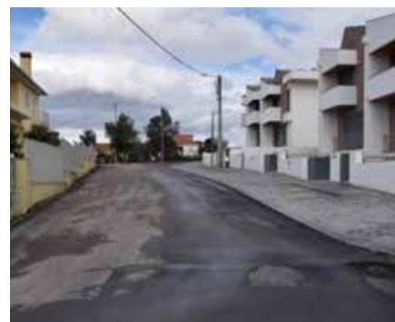
Rua Vale do Tojinho - Angeja