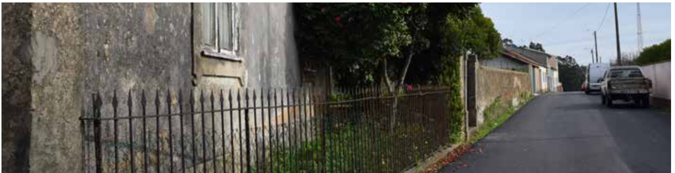
Rua do Barroco - Sobreiro