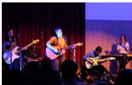
Minta & The Brook Trout