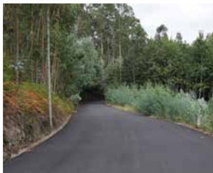
Rua do Vale da Magra - Frossos