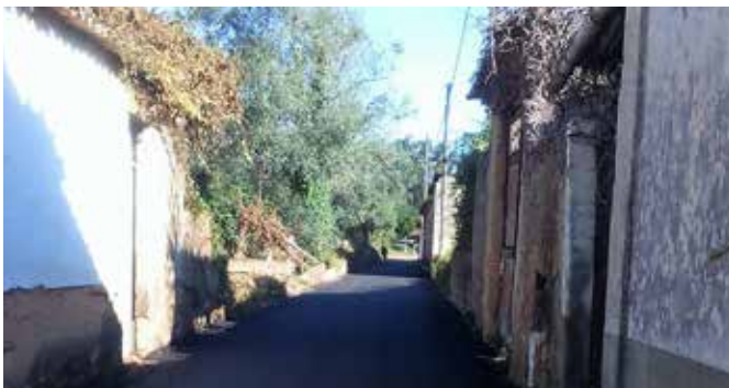
Rua das Cavadas - Alquerubim