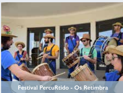
Festival PercuRtido - Os Retimbra