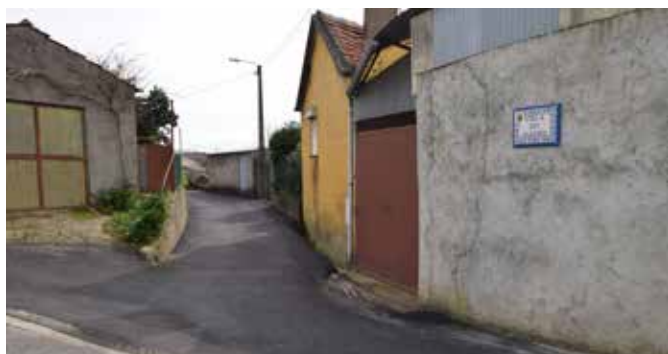
Víela do Jardim - Vila Nova de Fusos