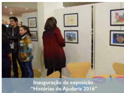
Inauguração da exposição "Histórias de Ajudaris 2016"