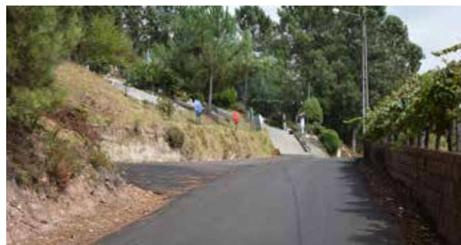
Rua dos Casais - São João de Loure