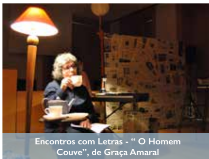
Encontros com Letras - "O Homem Couve", de Graça Amaral