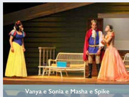
Vanya e Sonia e Masha e Spike