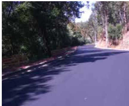
EN16 - Valmaior