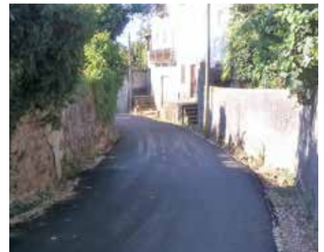
Rua da Barca - Alquerubim