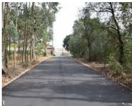
Rua da Boa Vista - Alquerubim