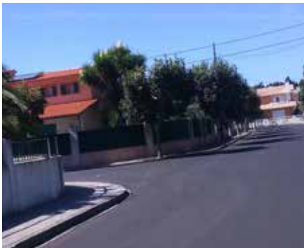
Bairro da Senhora da Nazaré - Sobreiro