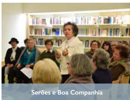
Serões e Boa Companhia