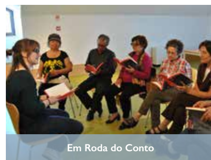
Em Roda do Conto

A Biblioteca Municipal de Albergaria-a-Velha continua a ser o equipamento com maior afluência de público, não apenas pelo seu acervo bibliográfico e localização privilegiada, mas também pelas inúmeras atividades que desenvolve ao longo do ano: exposições, conferências, palestras, encontros, tertúlias, visitas, entre outras.