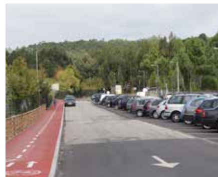
Ciclovía da Branca