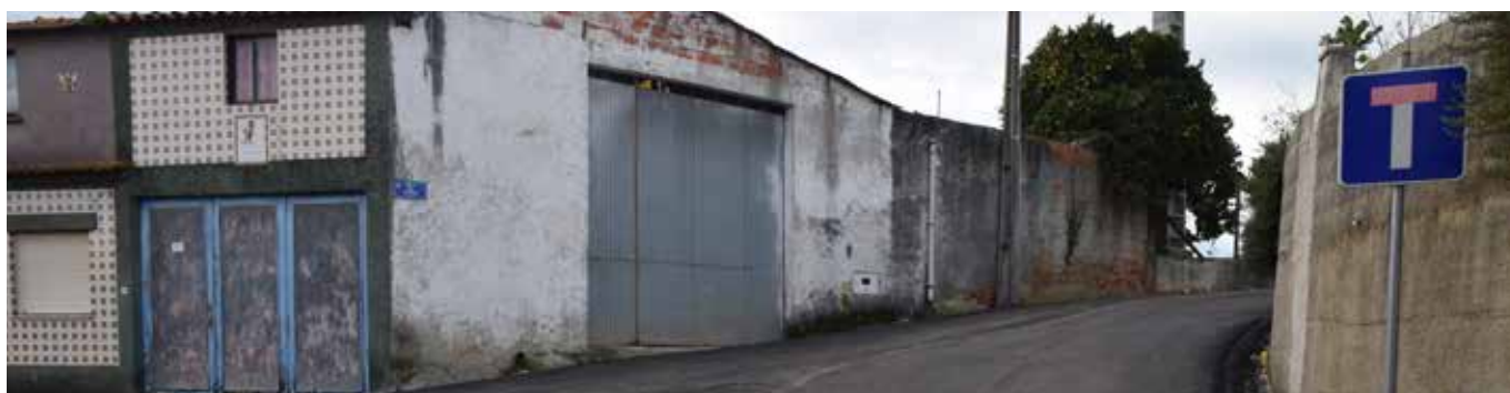
Víela da Deveza - São João de Loure