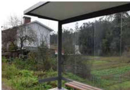
Abrigo de passageiros em vários locais do Concelho