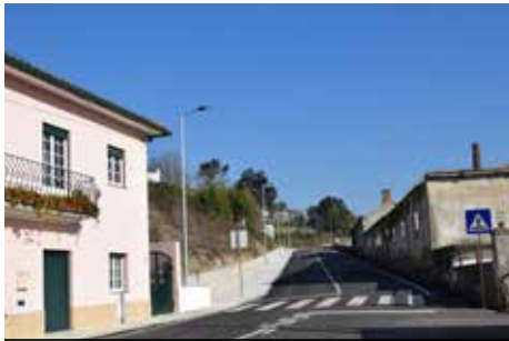
Correção do traçado da EN 16-3 - Valmaior