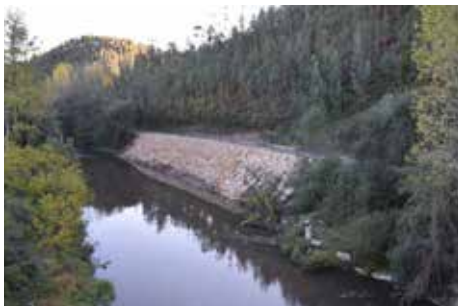
Reforço de talude no Rio Caima – Estrada para Açores, Valmaior