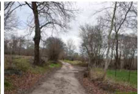
Reposição de caminhos e execução de suportes no Baixo Vouga – São João de Loure, Frossos e Angeja