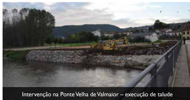
Intervenção na Ponte Velha de Valmaior – execução de talude

execução da rede de drenagem de águas pluviais, a pavimentação da via, a colocação de guardas de segurança e de sinalização horizontal e vertical. A obra implicou um investimento de 58 726 euros e foi executada no âmbito do Fundo de Emergência Municipal.