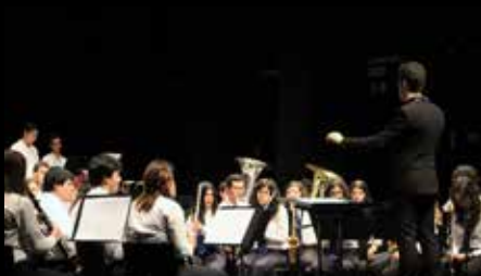
Banda do Grupo Desportivo Cultural Ribeira