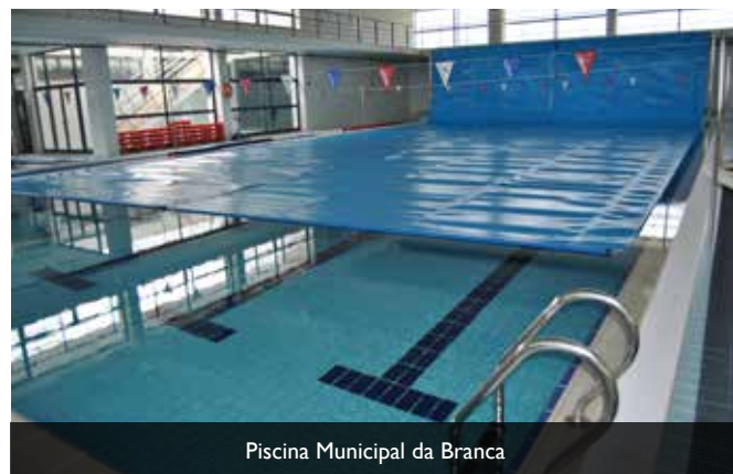
Piscina Municipal da Branca

A intervenção na Piscina da Branca tinha já contemplado a substituição da iluminação por lâmpadas LED e a colocação de painéis fotovoltaicos.