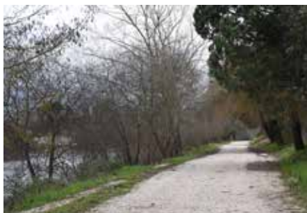
Reposição de caminhos e execução de suportes no Baixo Vouga – São João de Loure, Frossos e Angeja