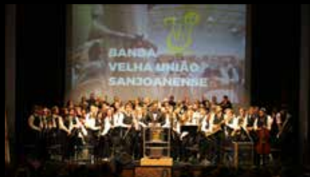
Banda Velha União Sanjoanense