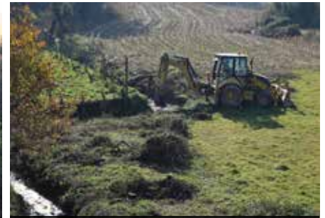
Limpeza de cursos de água em vários locais do Concelho