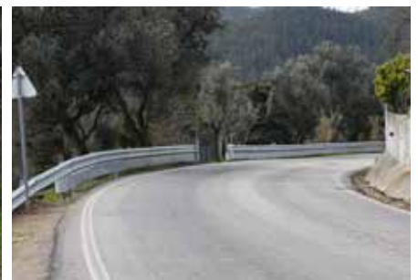
Execução de guardas de segurança em vias do Concelho