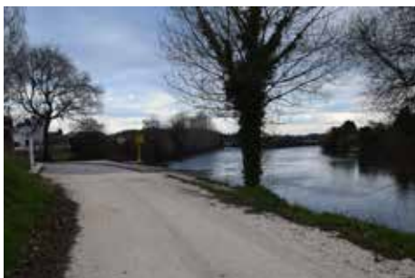
Reposição de caminhos e execução de suportes no Baixo Vouga – São João de Loure, Frossos e Angeja