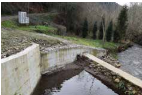
Execução de muro de suporte no Rio Fílvada em Vilarinho de São Roque – Ribeira de Fráguas