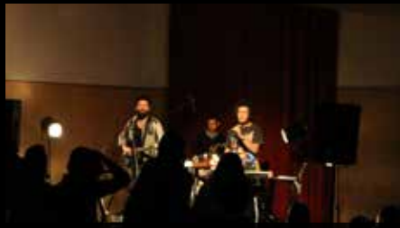
Thunder & Co