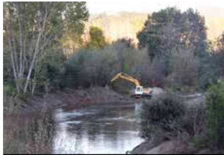
Limpeza das margens do Rio Caima – parceria entre a Junta de Freguesia de Albergaria-a-Velha, Valmaior e Câmara Municipal