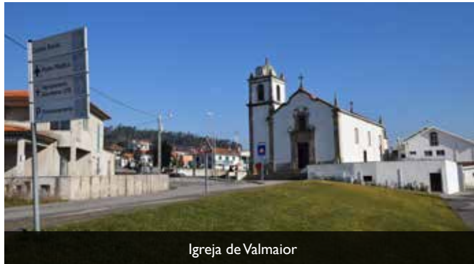
Igreja de Valmaior

A Câmara Municipal, através da Divisão de Ambiente e Serviços Urbanos, realizou uma intervenção no Largo da Igreja de Valmaior.