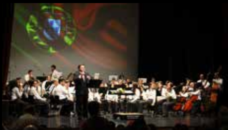
Associação de Instrução e Recreio Angejense