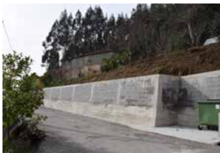
Execução de muro de suporte na Rua de Fráguas – Ribeira de Fráguas