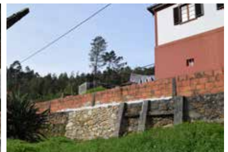
Execução de muro de suporte na Vila da Courela – Nobrijo - Branca