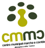
Comemoração do 1º aniversário do CMMC de Albergaria-a-Velha 18 de março