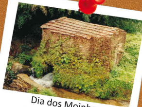
Dia dos Moinhos Abertos de Portugal 31 de março e 1 de abril