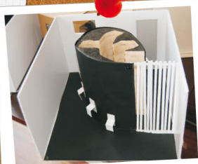
Exposição "Ideias Criativas para Museu Escola" de 10 a 30 de março