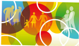
Ciclo "PAPÉIS DA generosIDADE" de 3 a 31 de março