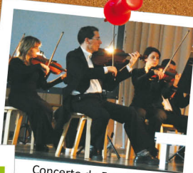
Concerto de Família, pela Orquestra Filarmonia das Beiras 3 de março