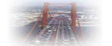
O Ozono é um dos principais componentes da poluição atmosférica

Mesmo em níveis baixos pode causar uma série de problemas respiratórios graves. Contudo, podemos ter alguns cuidados para ajudar a proteger a nossa saúde contra os seus efeitos.